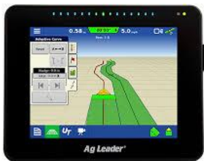
Figure 1: InCommand 800